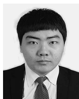
孫 天航 君 北海道大学大学院 (池田賢一) 「6000系アルミニウム合金の時効硬化挙動に及ぼす自然時効および予ひずみの影響」