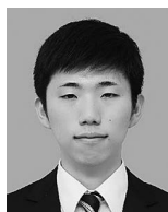
河村 宥成 君 日本大学大学院 (渡邊満洋) 「電磁圧接したアルミニウム/アルミニウムめっき鋼接合材の界面組織」