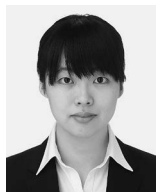
内山 愛文 君 東北大学大学院 (吉見享祐・安藤大輔・須藤祐司・小池淳一) 「Mg-Gd-Zn合金の機械的特性に及ぼすミルフィーユ型組織の影響」