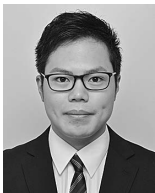
亀甲 真 君

「Al-Mg-Zn 3元系合金のT-Al 6 Mg 11 Zn 11 相の析出形態と時効強化挙動」