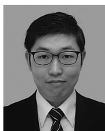
安江 航紀 君 山梨大学大学院 (中山栄浩・猿渡直洋) 「最終時効処理前の短時間加熱が6061アルミニウム合金の2段階時効挙動に及ぼす影響」